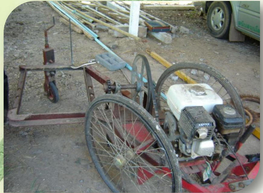
เครื่องตัดหญ้าขนาด 5.5 แรงม้า