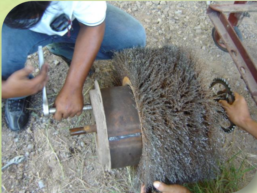
มูลฝอยพร้อมน้ำ