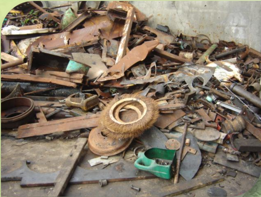
วัสดุที่นำมาตัดแปลง