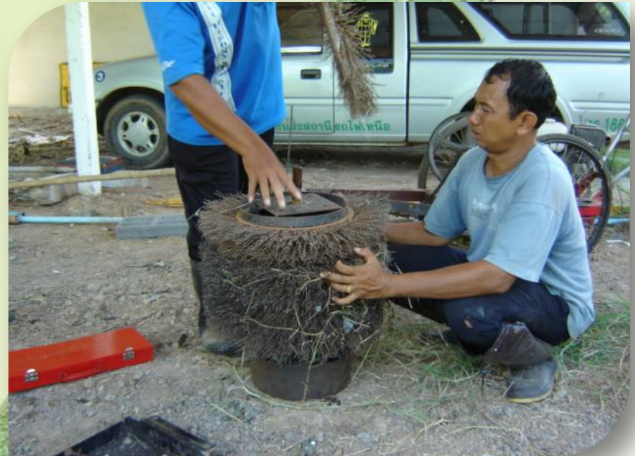
ชุดไบกวาด (ของเก่า)